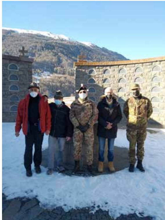
La Delegazione ha fatto visita all'ossario di Burgusio