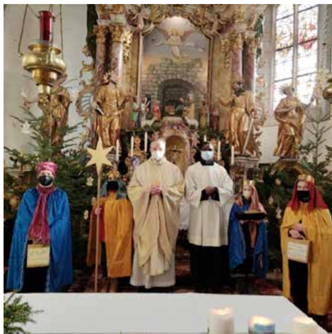
Die Sternsinger am Dreikönigstag 2022 in der Pfarrkirche von Tartsch

Ein großes Dankeschön den Jugendlichen für ihren Einsatz.