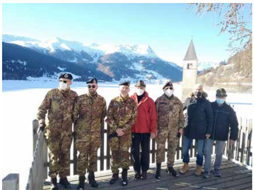
Visita al famoso campanile del lago di Resia