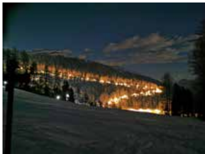
Rodelbahn am Watles

Nostalgisches Ski- und Heuschlittrennen am Watles