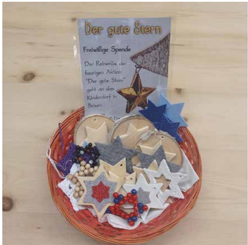
die Körbchen mit den gebastelten Sternen