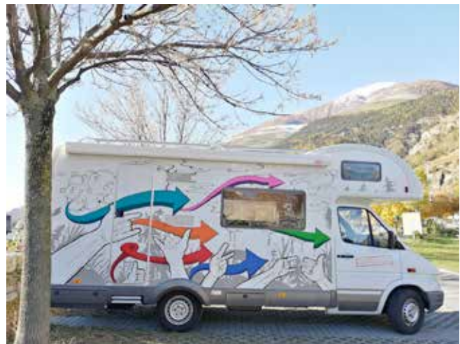
Camper Mobile Jugendarbeit Vinschgau

Wer wissen möchte wo die Mobile Jugendarbeit unterwegs ist, findet alle aktuellen Infos auf Facebook und Instagram.