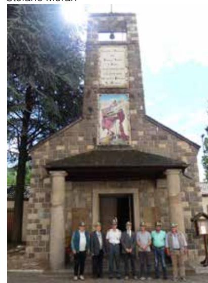
il gruppo posa d'avanti alla chiesetta all'interno della scuola