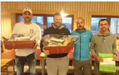
3.4 NC. Herren