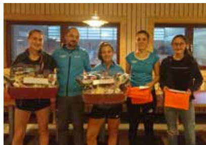
3.4 NC. Damen