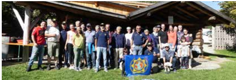
foto ricordo . la grigliata ipa presso il parco gioco di Clusio

Alla grigliata si sono presentati una cinquantina di persone che hanno trascorso una giornata intera all'insegna dell'allegria, grazie anche ad