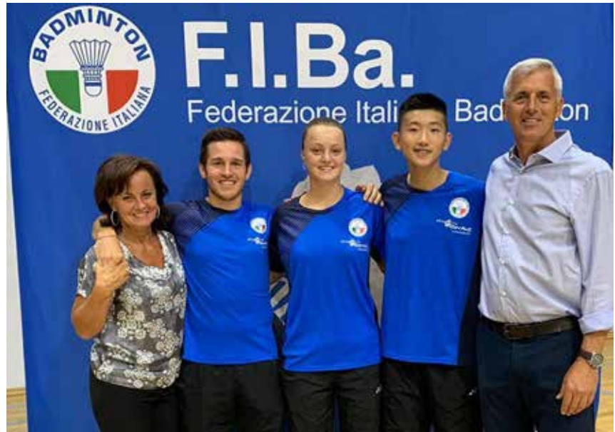
Die drei erfolgreichen Malser Nachwuchsspieler bei den Landesmeisterschaften U13-u19 in Bozen