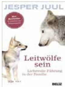
Leitwölfe sein von Jesper Juul

Kindern kann nichts Besseres passieren als Eltern, die liebevoll ihre Führungsrolle in der Familie wahrnehmen. Klare Entscheidungen treffen, dabei auch Unpopuläres durchsetzen und zu einem zeitgemäßen Autoritätsverständnis finden - der erfahrene Familientherapeut Jesper Juul ermutigt Mütter und Väter, einen Führungsstil zu entwickeln, an dem alle wachsen: Kleinkind, Teenager und nicht zuletzt die Eltern selbst. Die Neuausgabe wurde um Gespräche zu Schlafproblemen, Geschwisterstreit und weiteren Themen, die eine klare Führung der Erwachsenen verlangen, erweitert.