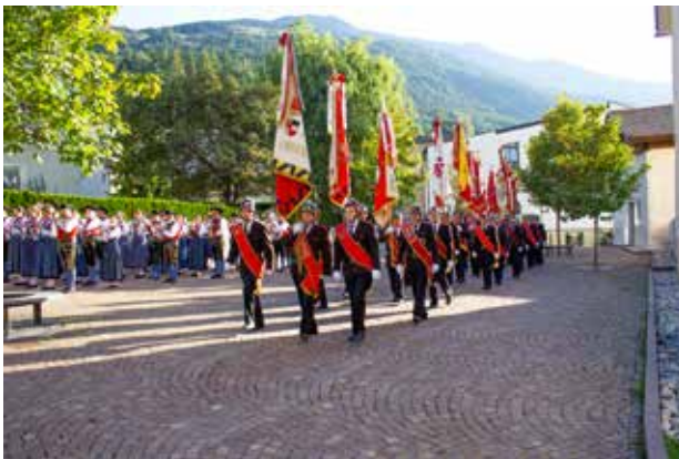
Einzug über den Jakobsplatz in die Pfarrkirche

Nach einem kleinen Aperitiv wurde die Drehleiter vorgestellt und wer wollte konnte aus 32 Metern Höhe sich ein Bild von unserer wunderschönen Umgebung machen. Jung und Alt nahmen diese Gelegenheit in Anspruch. Viel Glück und Gespür den Feuerwehrleuten, die mit diesem Fahrzeug, sei es im Einsatz und auch sonst unterwegs sind..