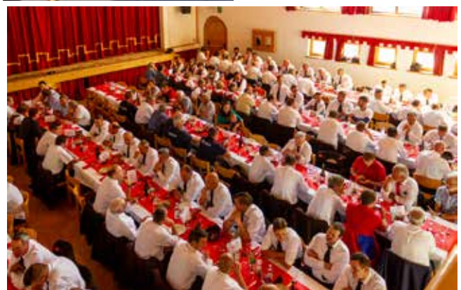
Mittagessen im Kulturhaus von Mals. Aus Mannis Küche wurden Köstlichkeiten ins. aus der regionalen Gegend, serviert.