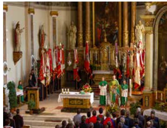
Die Fahnenabordnungen am Altar der Pfarrkirche