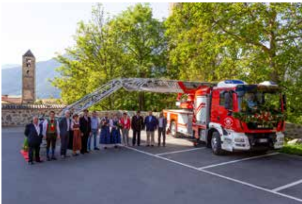
Vertreter der Gemeinden und Fraktionsverwaltungen