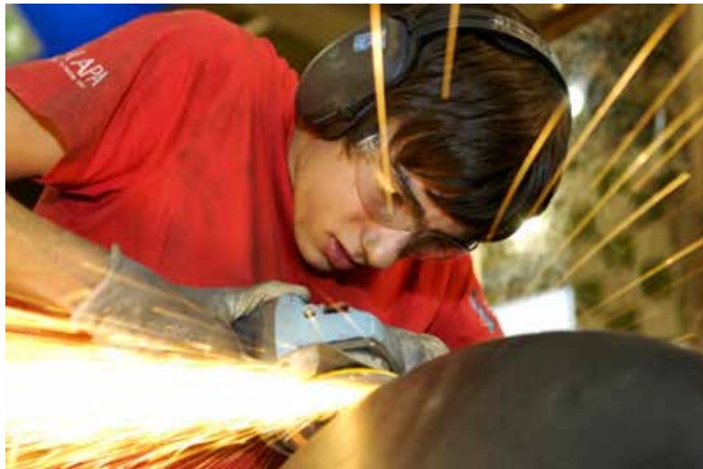
Schmied und Schlosser – Beruf mit Zukunft

„Die Berufe im Hotel- und Gastgewerbe sind sehr vielseitig, man ist ständig in Kontakt mit Gästen aus