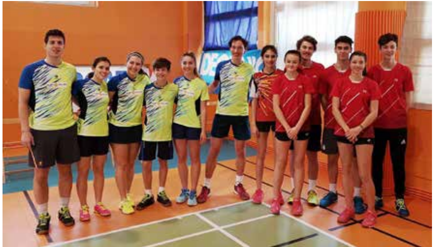
unserer Serie B Mannschaft beim Auswärtsspiel gegen Alba Shuttle, wo sie die Begegnung mit 3:2 gewinnen konnten.