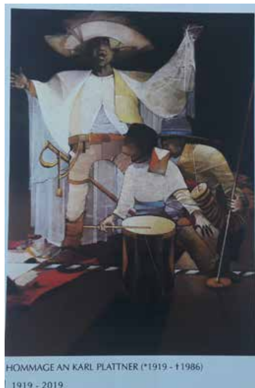
HOMMAGE AN KARL PLATTNER (*1919 - †1986)

In dieser Zeit war ich in einem so verzweifelten Zustand, in einer solchen Krise, dass ich alle Bilder in meinem Atelier zerstörte, außer einem, das ich meiner Frau schenkte. Und als ich dann im leeren Atelier saß war ich zufrieden.