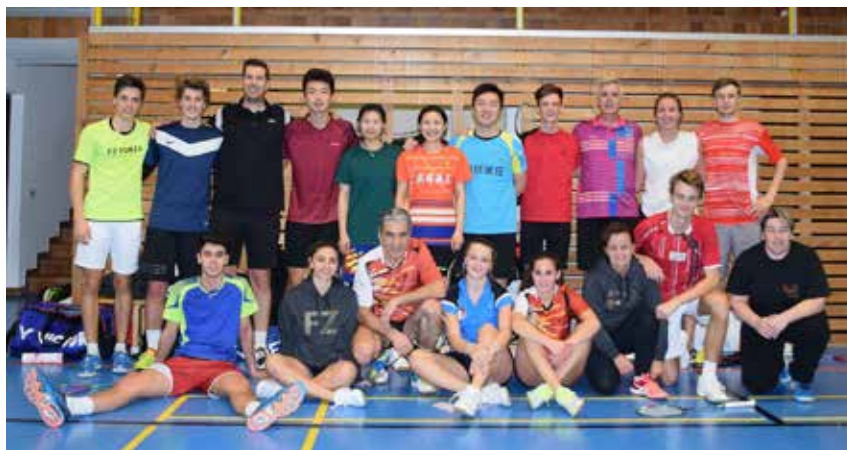
hochrangiger Badmintonbesuch aus China - drei Weltklasse-Badmintonspieler weilten fast ein Monat lang in Mals