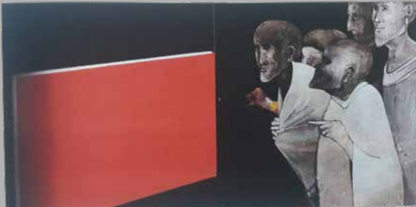
978 M 1.738

für Laatsch, Tartsch, Mals, Schleis, Burgeis, Ulten, Alsack, Matsch, Planeil, Plawenn und Schlinig/Amberg