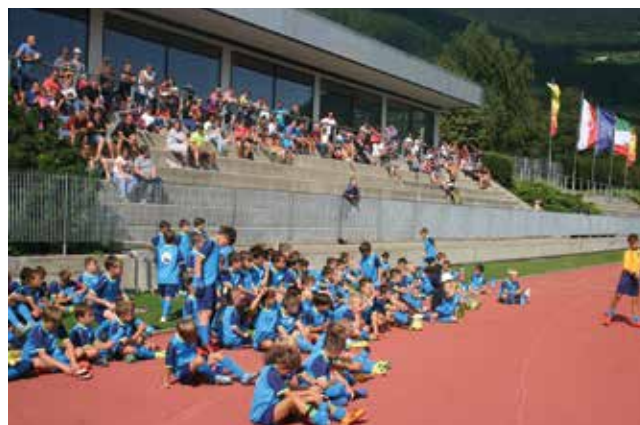
Teilnehmer und Publikum beim Hans Dorfner Camp 2017