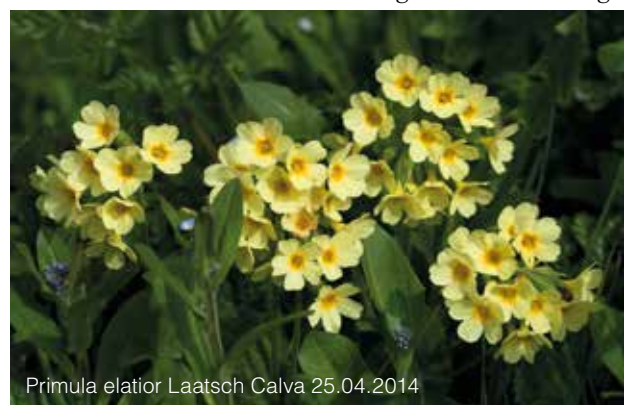
Primula elatior Laatsch Calva 25.04.2014

Im Volksmund als „Blauer Himmelschlüssel“ bezeichnet, ist das weichborstig behaarte Südliche Lungenkraut nicht mit den Schlüsselblumen, sondern mit dem Vergissmeinnicht und dem Beinwell verwandt. Die Blüten sind beim Aufblühen rötlich gefärbt und wechseln dann die Farbe nach blauviolett. Das Lungenkraut ist eine Heilpflanze, was bereits sein Name ausdrückt. |