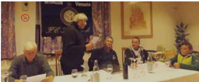
l'incontro conviviale dell'Inter club di Malles