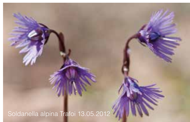
Soldanella alpina Trafoi 13.05.2012