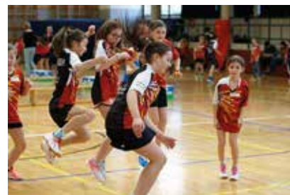
bewegte Kinderolympiade, mit viel Einsatz sind unsere Kleinsten immer dabei (hier beim Seilspringen)

VSS-Raiffeisen- Kinderolympiade in Eppan 12 Mannschaften waren am 19.02.