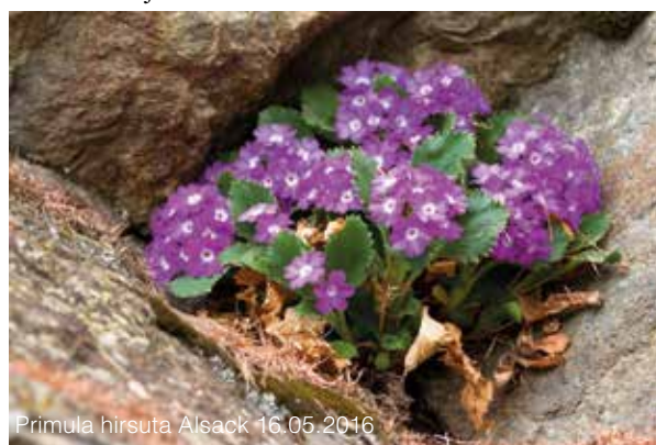
Primula hirsuta Alsack 16.05.2016