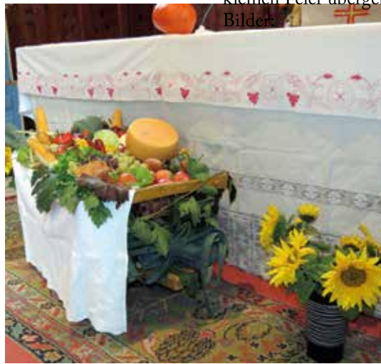
„Ziach-Wagele“ mit den Feldfrüchten vor dem Altar