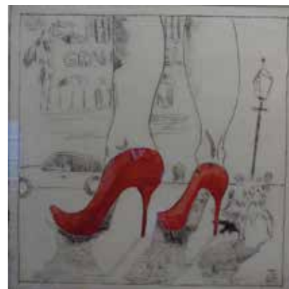
Grand Hotel, Radierung, 2016