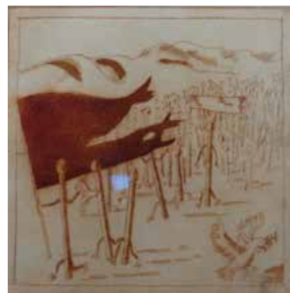
Brandstifter, Radierung, 2016

er in der Ausgabe 2011 mit einem Interview vertreten ist.