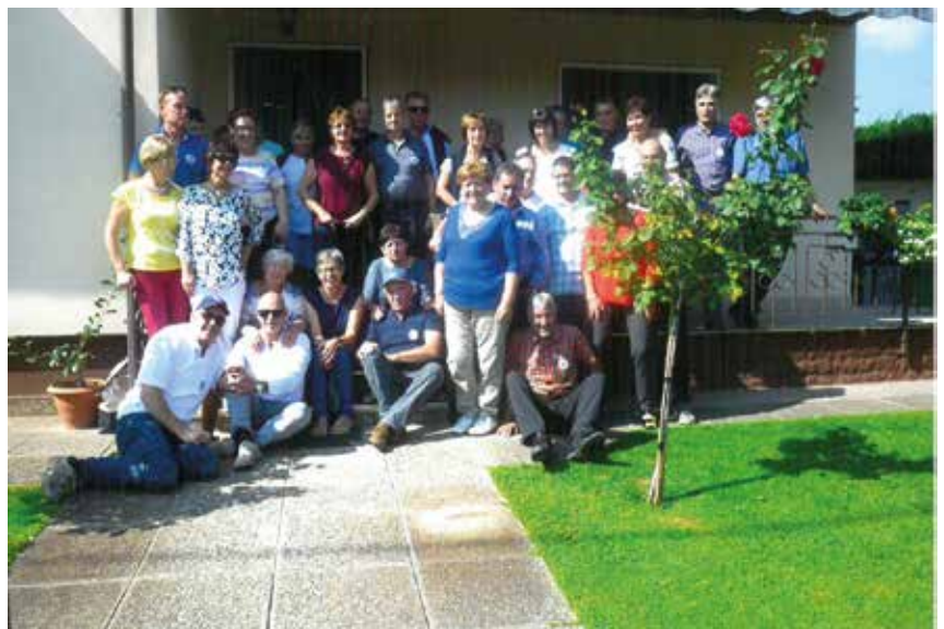
Der Jahrgang 1956 in Rosolina Mare

Am 24. und 25. September versammelten sich die 56ler beim Oberschulzentrum in Mals um zum Jahrgangsausflug zu starten. Halbmittag zum Genießen in der Forst in Algund und gestärkt ging es weiter nach Rosolina Mare. Am Abend köstliches Essen mit Fischspezialitäten und Übernachtung in Rosolina Mare. Nach einem genusslichen Frühstück, Rundgang in Chioggia und anschließend auf zur Rückfahrt nach Mals. Der gebührende Abschluss: ein Abendessen im Forst von Mals, wo man die beiden Tage in geselliger Runde passieren ließ.