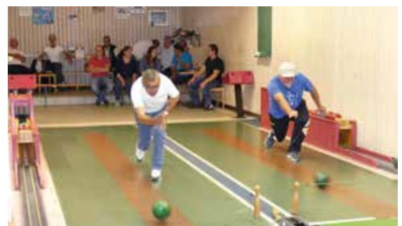
Due soci impegnati sulle piste da bowling, si danno battaglia nel corso della manifestazione..