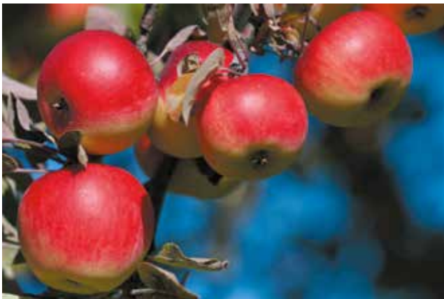
Alter Hochstamm-Apfelbaum mit Kaltereräpfeln