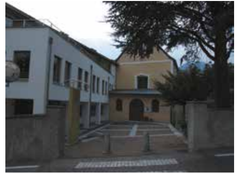
la chiesa dove alla domenica si teneva la messa in italiano a Malles

L'annuncio del decano Heinz di dover procedere, secondo disposizioni impartite dall'alto, alla soppressione della messa in lingua italiana non è stato per niente digerito dai tanti fedeli. Anche perché la funzione religiosa era comunque seguita dai fedeli,