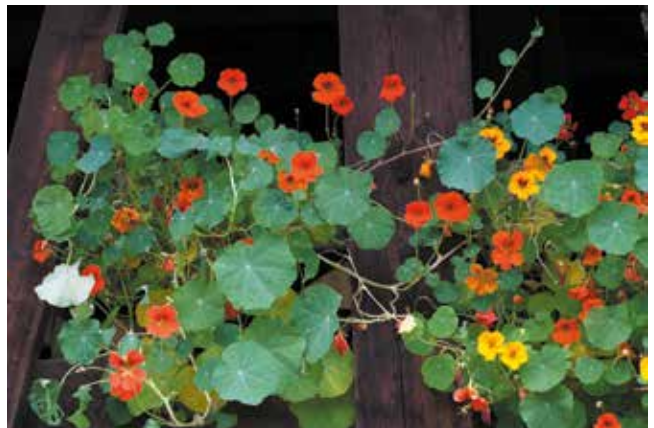
Kapuzinerkresse am Holzschuppen