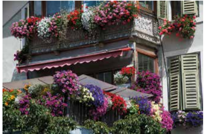
Blütenpracht am Balkon (Unterdorf, Mals)