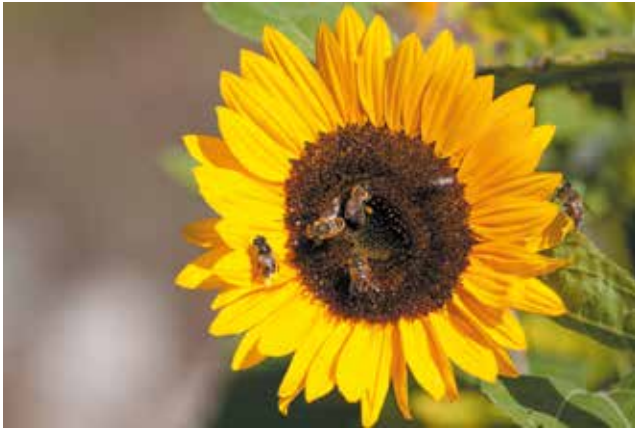
Sonnenblume mit Besuch von einer Honigbiene (hat Pollenhöschchen an den Hinterbeinen) und mehreren Schwebfliegen