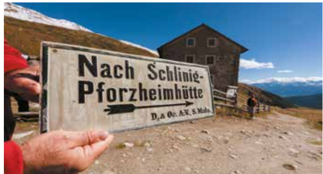
Alte Pforzheimer Hütte