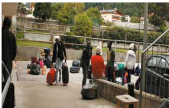
Die Asylanten bei ihrer Ankunft im Haus Ruben