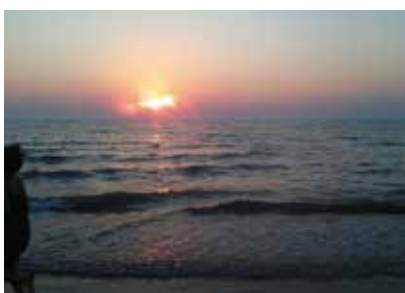
MALS | Jugend