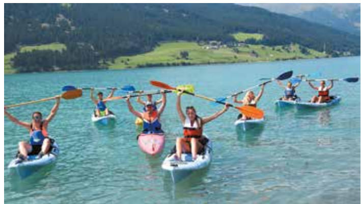
Krafttraining einmal anders: beim Kanufahren am Reschensee