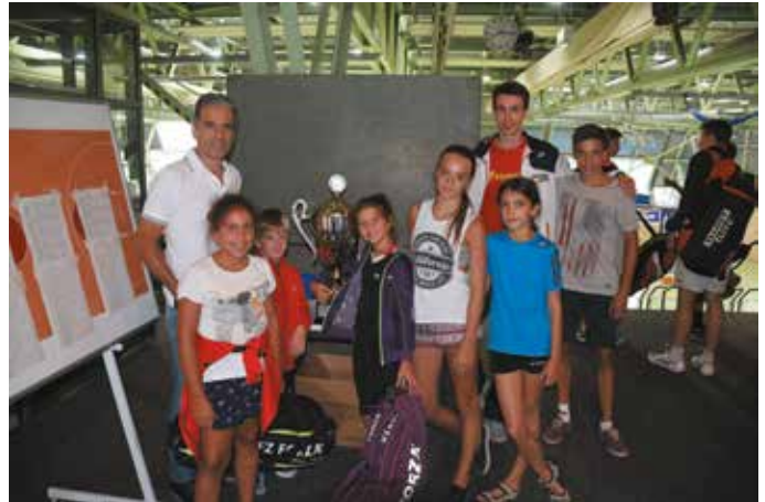
Die kleine Malser Delegation beim Hexencup in Konstanz am Bodensee