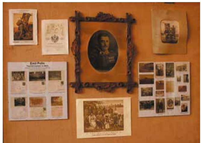
zu sehen in der Ausstellung zum 1. Weltkrieg