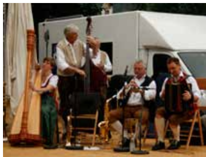
die Nauderer Schupfamusik