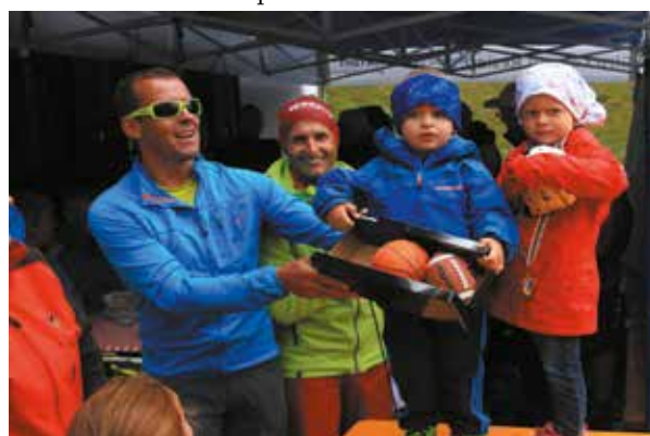
Auch die Kleinen haben ihren Spaß und freuen sich über die Preise