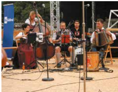
die Storchn Musi